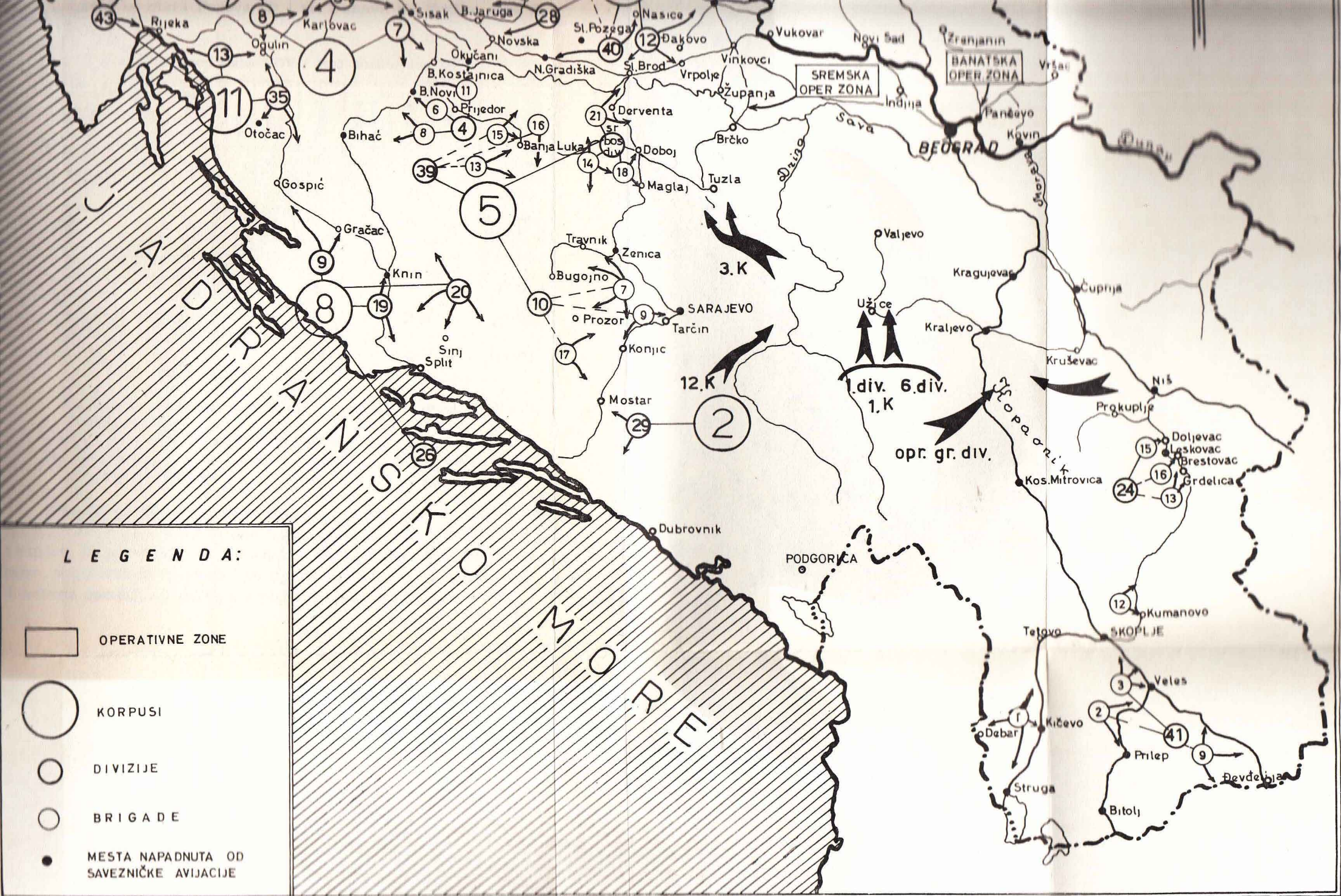
Pregled dejstava jedinica NOV i POJ po komunikacijama od 1. do 7. septembra 1944.